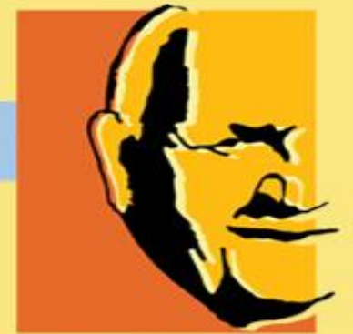
Alfred Grosser Schulzentrum Bad Bergzabern

Möglichkeit, deutsch-französisches Abitur zu machen (AbiBac)