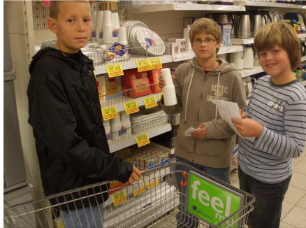
Preisvergleich beim Einkauf im Supermarkt.

Hier einige Bilder aus aktuellem Schuljahr. Schülerinnen und Schüler der Klassen 6c und 6f führten einen Pausenverkauf durch. Die Kuchen, Muffins und gebrannten Mandeln wurden von den Kindern selbst hergestellt.