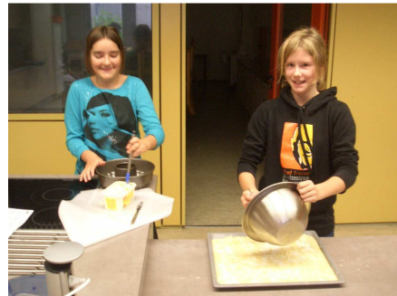
Die leckeren Kuchen werden hergestellt.