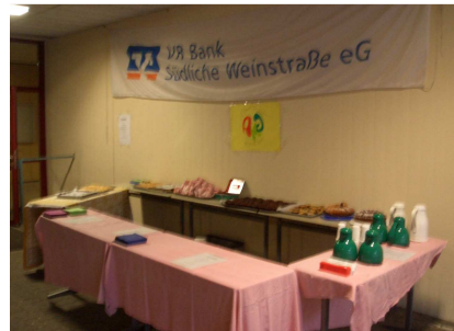
Alles ist bereit für den großen Ansturm. Die Schüler konnten die VR Bank SÜW als Sponsor gewinnen.