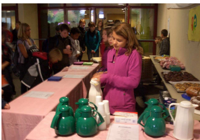
Der Verkauf ist ein voller Erfolg!

Abgesehen davon sollen den Schülerinnen und Schülern im Rahmen des Orientierungsangebots bereits frühzeitig Einblicke in die Berufs- und Arbeitswelt gegeben werden. In diesem Zusammenhang ist auch eine Betriebserkundung in einem Unternehmen der näheren Umgebung vorgesehen.