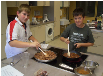
Die Herstellung der gebrannten Mandeln erweist sich schwieriger als gedacht. Doch das Ergebnis kann sich sehen lassen!